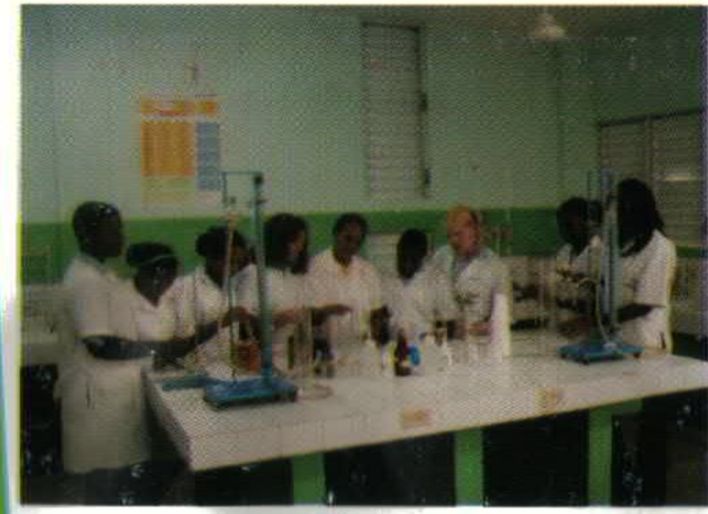
LABORATORIO DE CIENCIAS