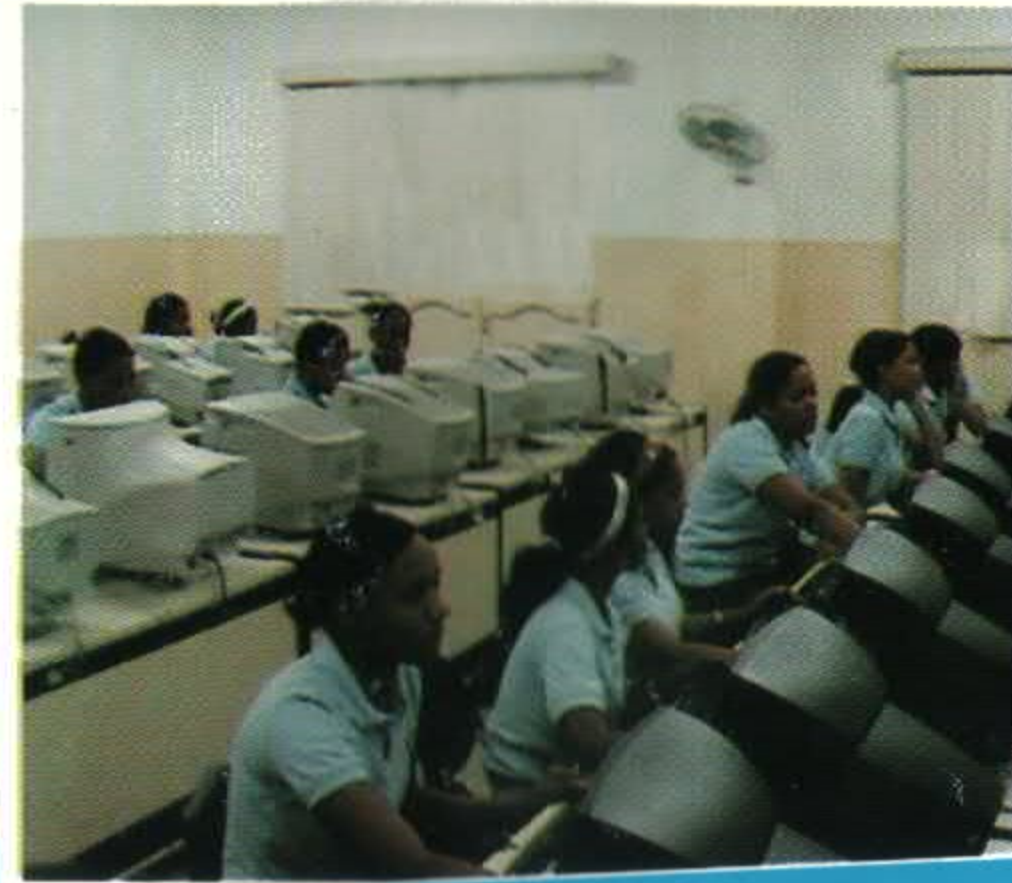
LABORATORIO DE INFORMATICA