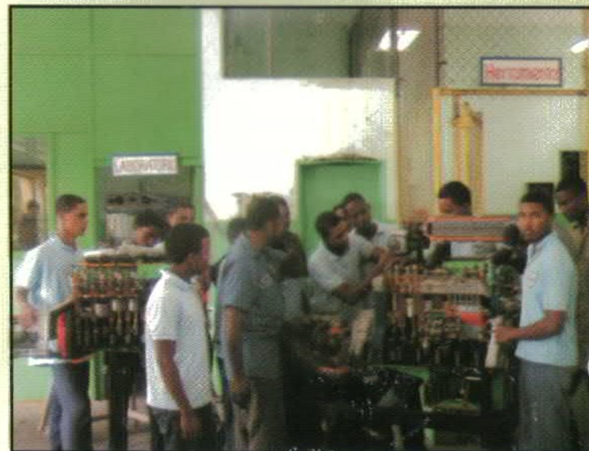
TALLER DE MECANICA