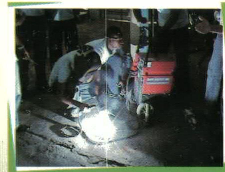
TALLER DE SOLDADURA