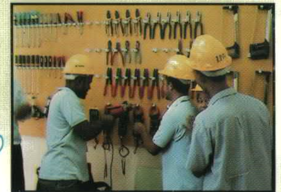
TALLER DE ELECTRICIDAD