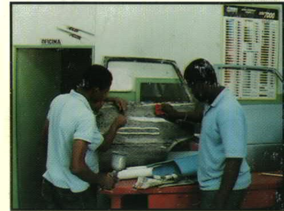
TALLER DE DESABOLLADURA Y PINTURA